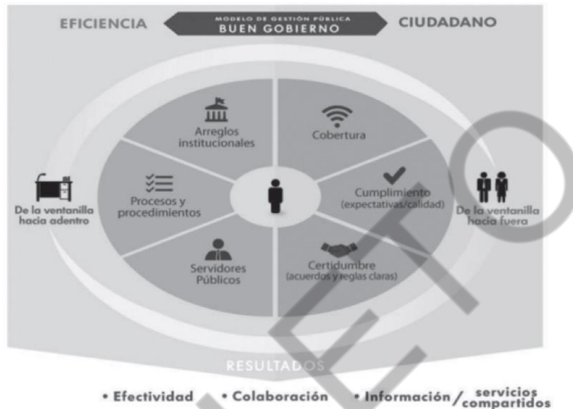
Modelo de Gestión Pública Eficiente al Servicio del Ciudadano